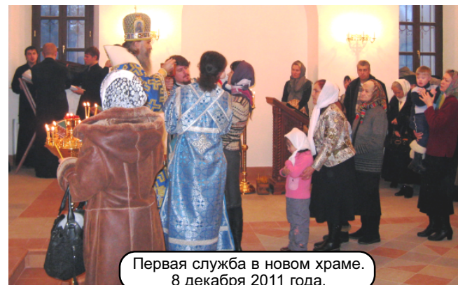
Первая служба в новом храме. 8 декабря 2011 года.

Ставим в сильно разогретую духовку, через 30 минут убавляем мощность духовки до 220 градусов. Готовность гуся можно определить по румяной корочке и по появлению аромата яблок. Это означает, что мясо готово и тепло духовки начало действовать на