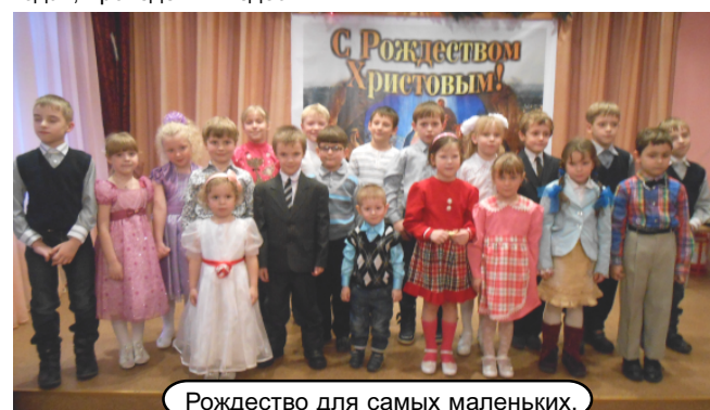
Рождество для самых маленьких.

Мне, как выпускнику Нравственно-патриотического объединения во имя Дмитрия Донского, хотелось бы поделиться своими впечатлениями, а заодно, как в пример настоящему, так и будущему поколению воспитанников в объединении, рассказать о годах, проведенных здесь.